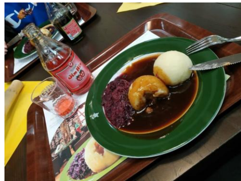
Zdjęcia z muzeum klusek ziemniaczanych